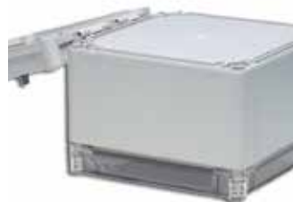
Montagemöglichkeit für zusätzlichen Deckel an der Rückseite des Gehäuses.