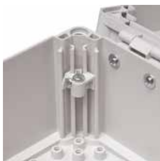
Stufenlose Höhenverstellung für Montageplatte oder andere Montagesysteme